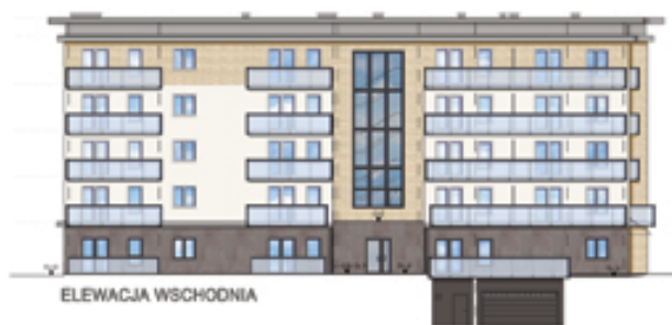
ELEWACJE - BLOK 1

I ETAP INWESTYCJI - BLOK 2 II ETAP INWESTYCJI - BLOK 1